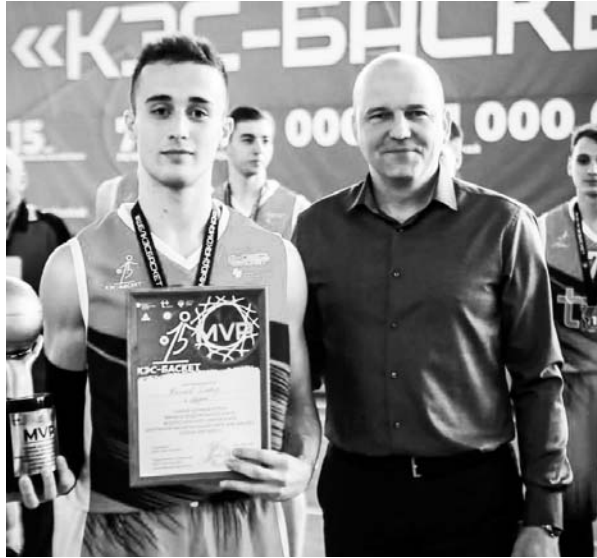
о победных выступлениях на спортивных аренах!